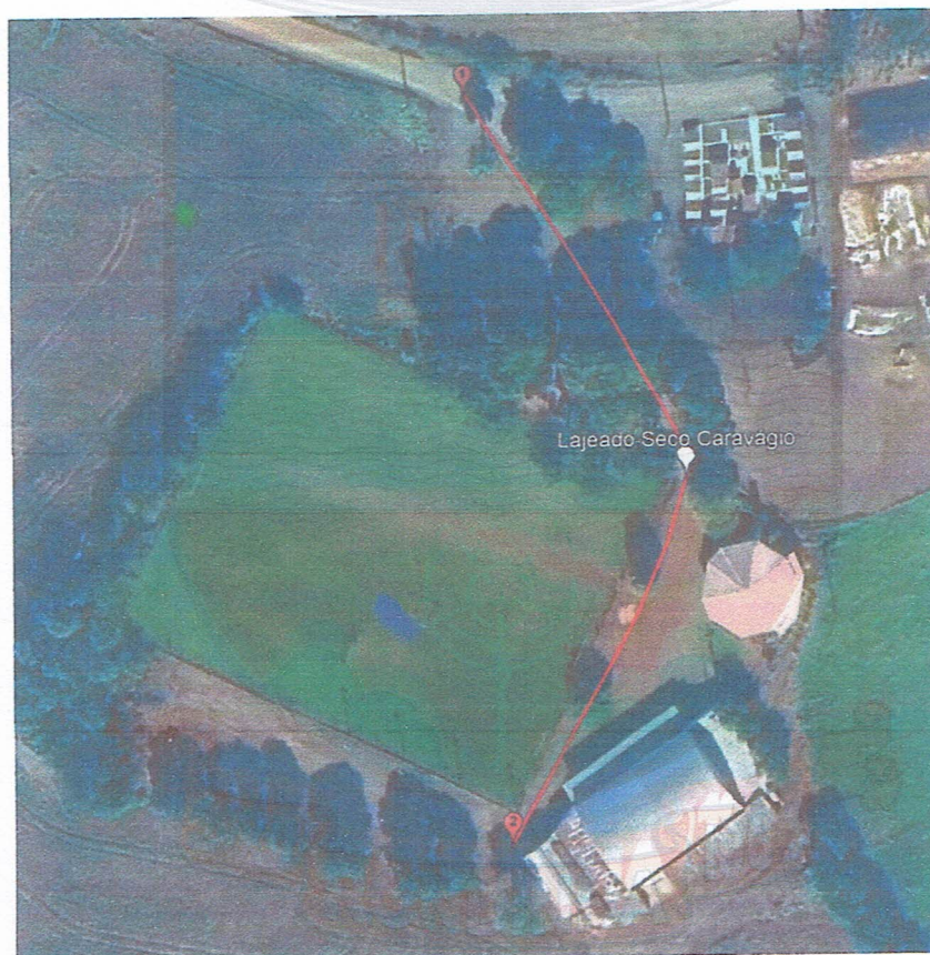
Figura 1 - Localização Estrada Vicinal, Linha Lajeado Seco Caravágio.

Ponto 2 – Lat. 27°50'28.44"S, Long. 52°57'45.88"O;