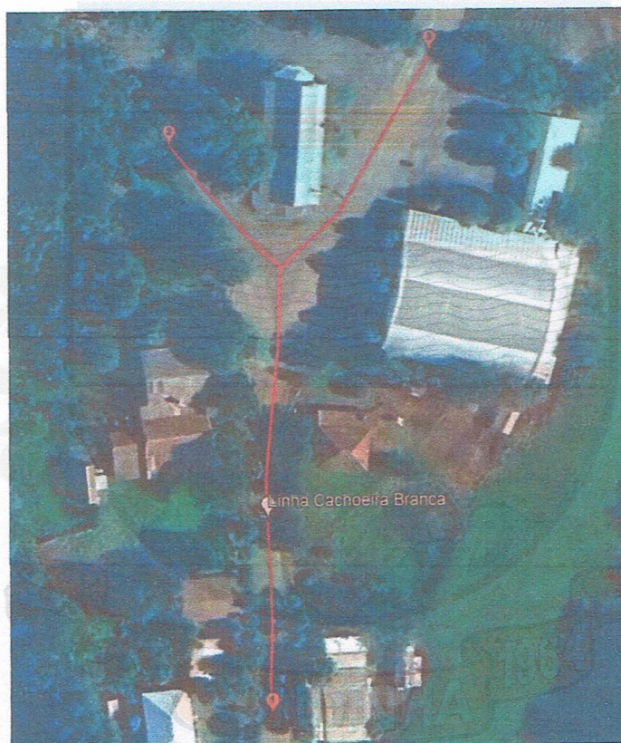
Figura 1 - Localização Estrada Vicinal, Linha Cachoeira Branca.

Ponto 3 – Lat. 27°48'59.67"S, Long. 52°57'32.73"O;