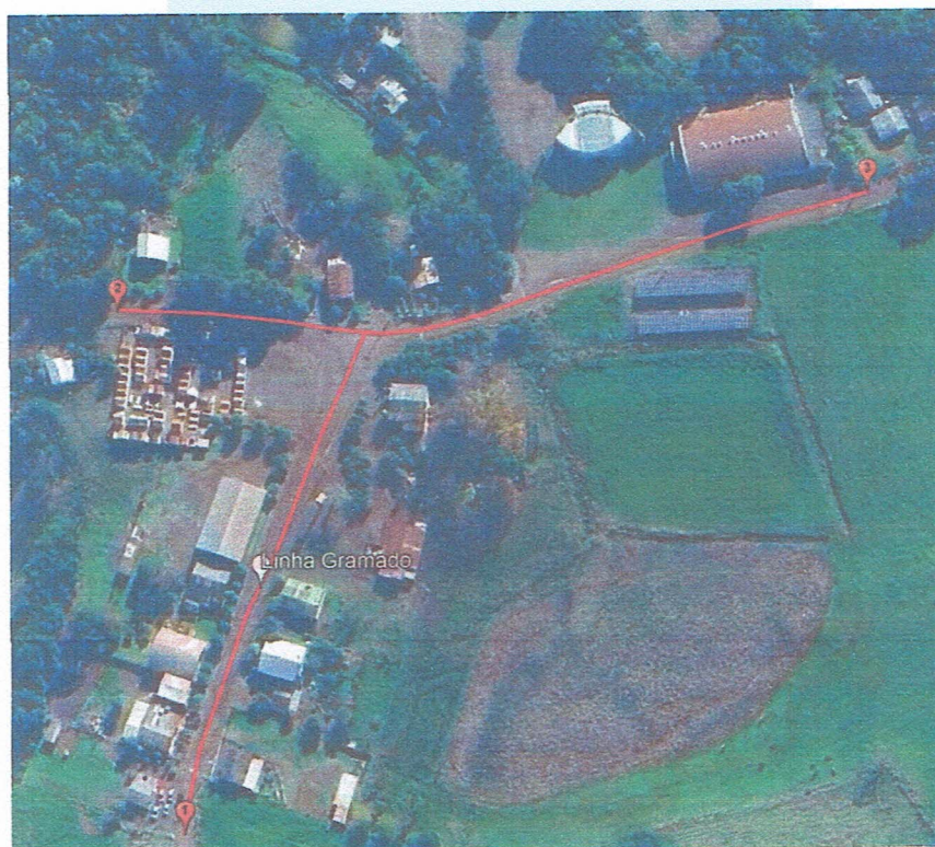
Figura 1 - Localização Estrada Vicinal, Linha Gramado.

Ponto 3 – Lat. 27°50'7.03"S, Long. 52°50'53.21"O;