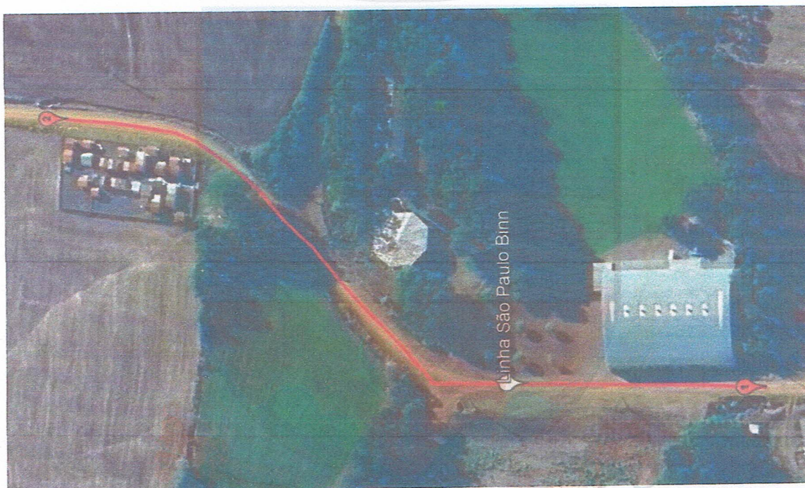
Figura 1 - Localização Estrada Vicinal, Linha São Paulo Binn.

Ponto 2 – Lat. 27°46'17.46"S, Long. 52°54'19.67"O;