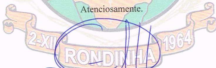
EZEQUIEL PASQUETTI Prefeito Municipal